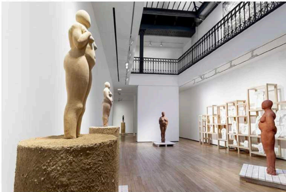
Vue de l'exposition « Vénus » de Prune Nourry à la galerie Templon à Paris, 2024

J'ai voulu montrer ces sculptures sur des socles en pisés [ mode de construction en terre crue, NDLR ]. C'est une technique qui est utilisée aussi pour révéler les strates du temps qui passe et qui ont un lien avec les carottages archéologiques comme les Vénus dont on s'inspire.