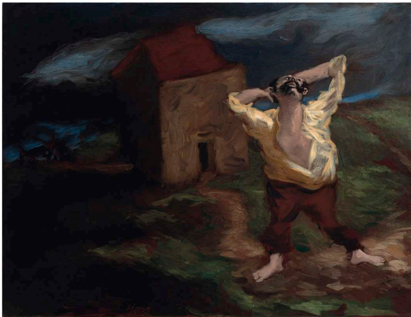
Le Réveil , 2012 Huile sur toile 89 x 116 cm — 35 x 45 5/8 in.