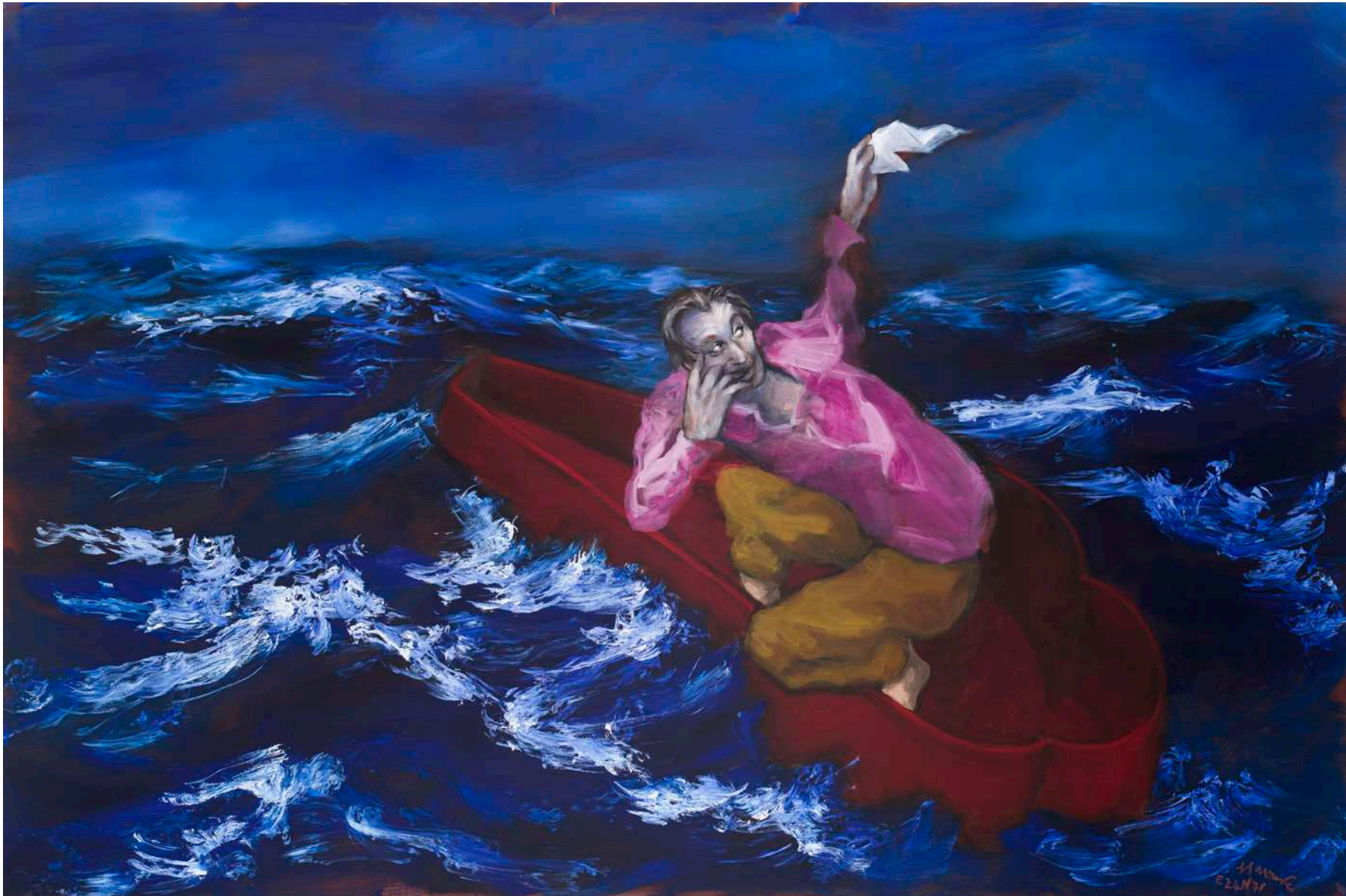
Le Sarcophage , 2012 Huile sur toile 130 x 195 cm — 51 1/8 x 76 3/4 in.