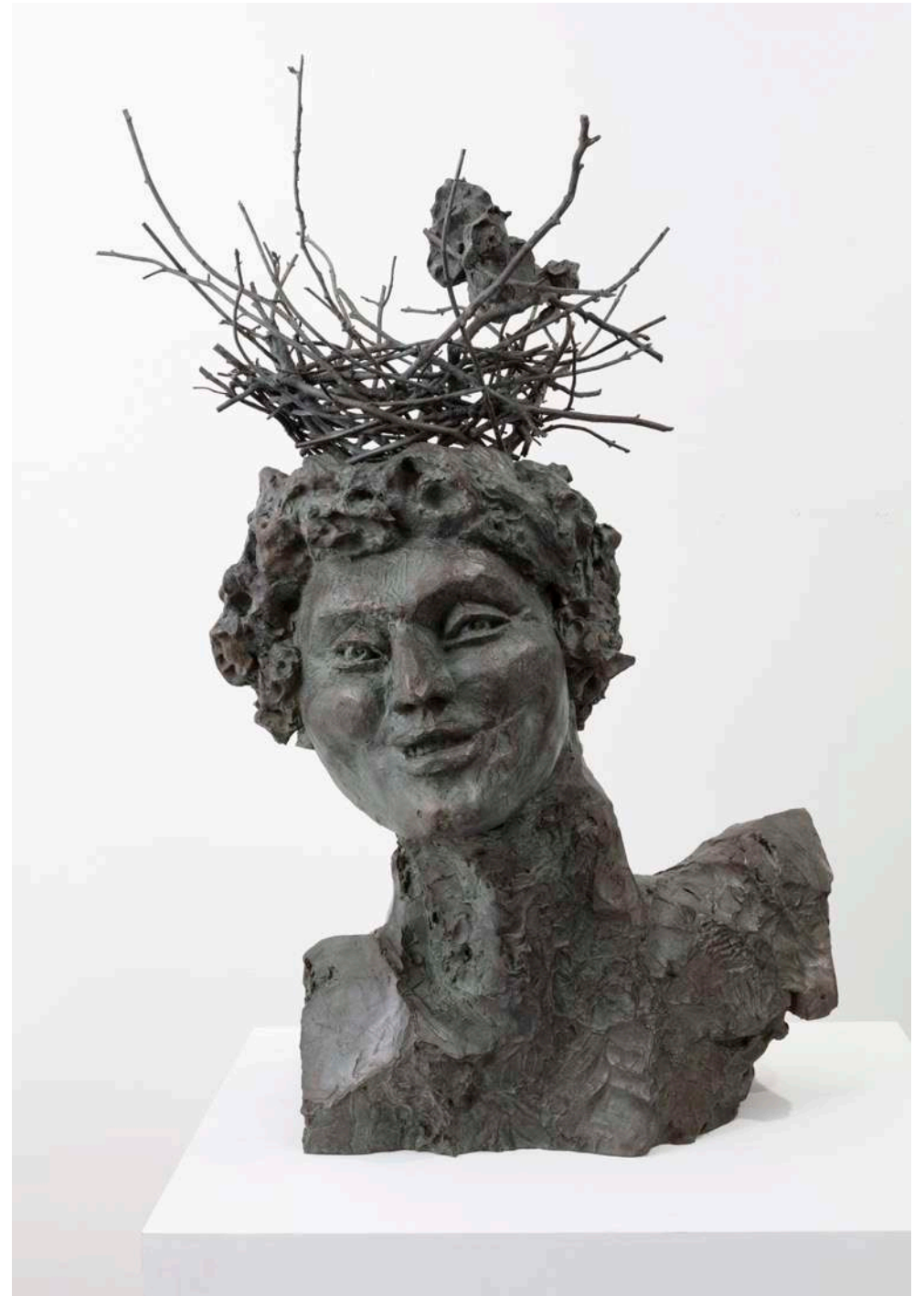
L'Indien et le nid d'oiseau , 2015 Bronze 110 × 75 × 55 cm — 43 2/7 × 29 1/2 × 21 5/8 in. AP 1/2 ( Edition /4 + 2 AP)