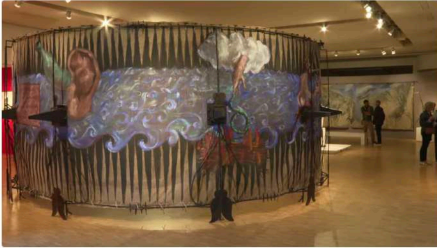
La "dive bacbuc", "une installation drolatique sur la lecture de Rabelais" - Gérard Garouste.

"On a travaillé ensemble sur Cervantes, sur Rabelais et puis évidemment sur le Talmud, qui sont des sources d'inspiration extraordinaires. Il y a l'exégèse, mais pour un peintre, c'est hallucinant."