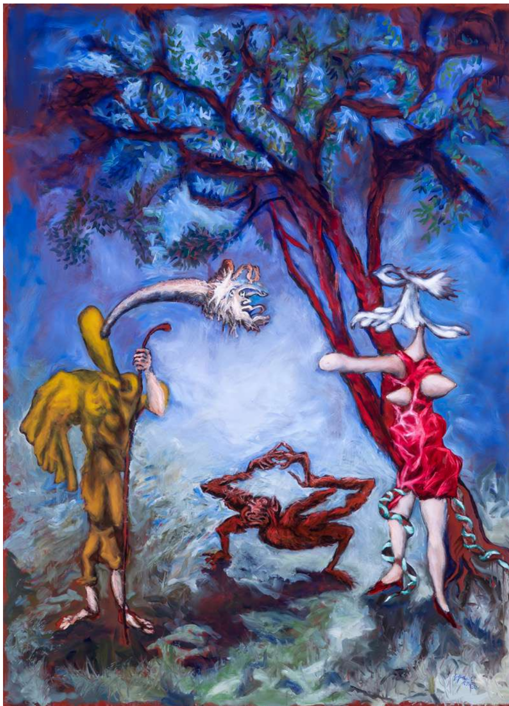
Lilith voilée , 2023 Huile sur toile 222 x 165 cm — 87 1/2 x 65 in.