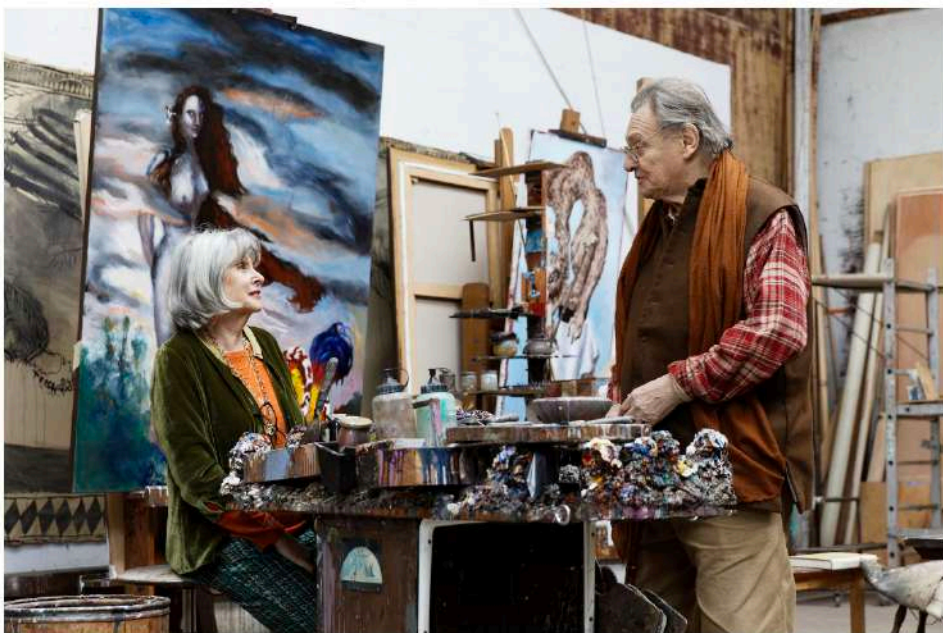
Gérard & Elizabeth Garouste.

Pour la toute première fois de leur carrière, une grande exposition rassemble le travail d'Elizabeth et de Gérard Garouste. Ce dialogue inédit entre leurs deux univers bigarrés et éminemment personnels se déploie au fil d'une centaine de pièces : peintures, dessins, gravures, sculptures, meubles et objets issus de collections publiques et privées.