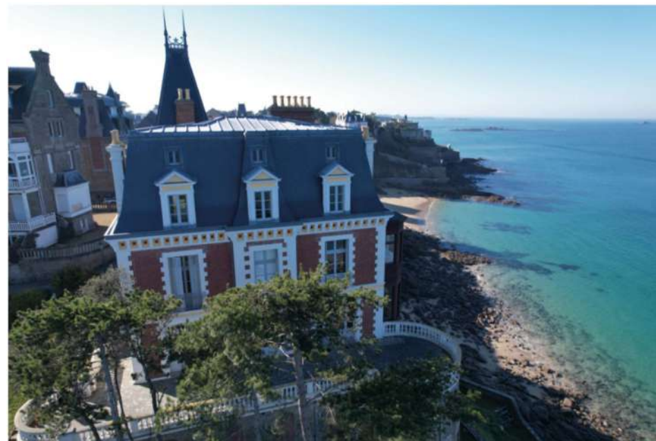
La villa « Les Roches Brunes » à l'extrémité de la pointe de la Malouine.

Édifiée entre 1893 et 1896 dans le style néo-Louis XIII par l'architecte breton Alexandre Angier (1838-1906), la villa « Les Roches Brunes » est l'une des plus remarquables de la station balnéaire par sa situation extraordinaire sur un promontoire rocheux, à l'extrémité de la pointe de la Malouine. Elle offre une vue à couper le souffle à la fois sur le cap Fréhel, l'île de Cézembre, les remparts de Saint-Malo et la ville de Dinard. Son commanditaire en est le couturier parisien Émile Poussineau (1841-1930), dit Félix, dont le frère, Auguste Poussineau (1831-1910), avait fait l'acquisition de terrains en bord de mer dans l'optique d'y créer un vaste lotissement. À la suite d'un revers de fortune, Félix dut se séparer de sa maison qui, après être passée entre les mains de divers propriétaires, fut léguée en 2007 à la ville de Dinard ; à charge pour cette dernière de la transformer en un lieu dédié à la culture, accessible à tous. Cet été, la villa « Les Roches Brunes » abrite un volet intimiste de l'exposition Garouste : dans une scénographie évoquant une maison d'artiste, objets, peintures, sculptures et mobilier conçus par les deux créateurs y sont mis en scène à la façon de period rooms ; un espace évoque la traditionnelle vente aux enchères annuelle de La Source qui, en décembre 2023, a rapporté 230 000 € sous le marteau de Frédéric Chambre de la maison Piasa.