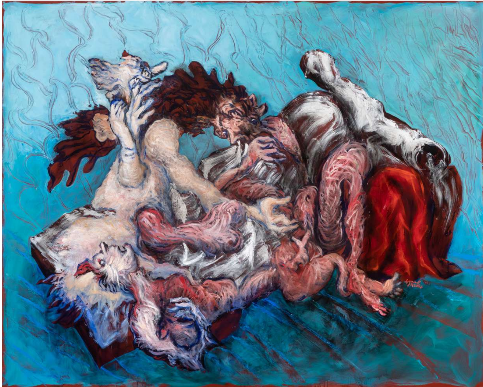
Orgie , 2023 Huile sur toile 160 x 201 cm — 63 x 79 1/4 in.