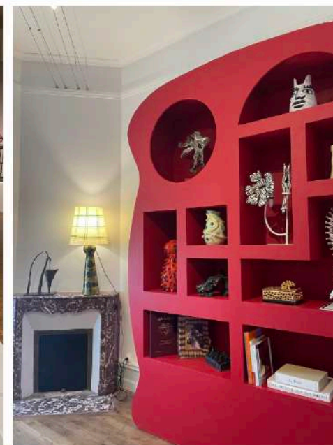
À GAUCHE : vue d'une salle de l'exposition au Palais des Arts et du Festival avec des œuvres de Gérard Garouste. © N.d'A ; À DROITE : les œuvres d'Elizabeth Garouste à la villa « Les Roches