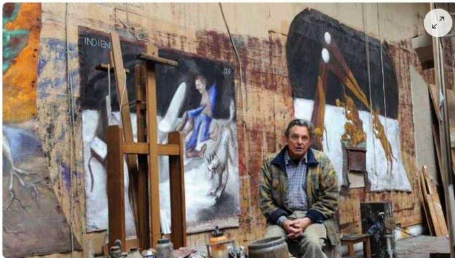
Gérard Garouste, artiste peintre dans son atelier.

La grande exposition de l'été se déroulera dans deux lieux, à Dinard (Ille-et-Vilaine) en 2024. Le Palais des arts et du festival et la villa Les Roches Brunes vont accueillir les œuvres de la designer Elizabeth Garouste et du peintre Gérard Garouste.