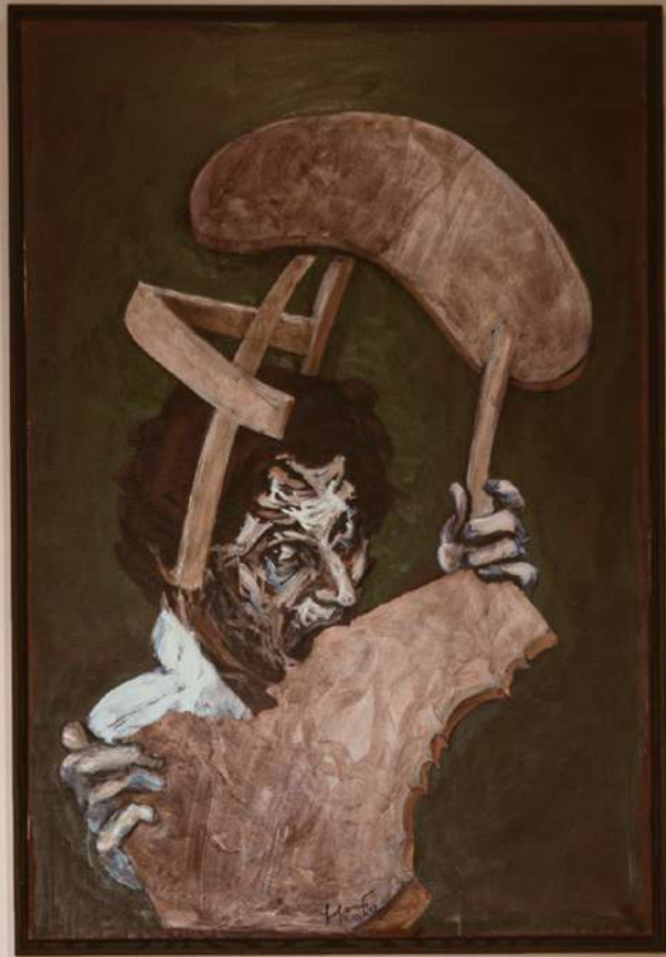
Edward Gorey The Painter's Progress (1964) Oil on canvas 18 1/2 x 14 1/2 inches