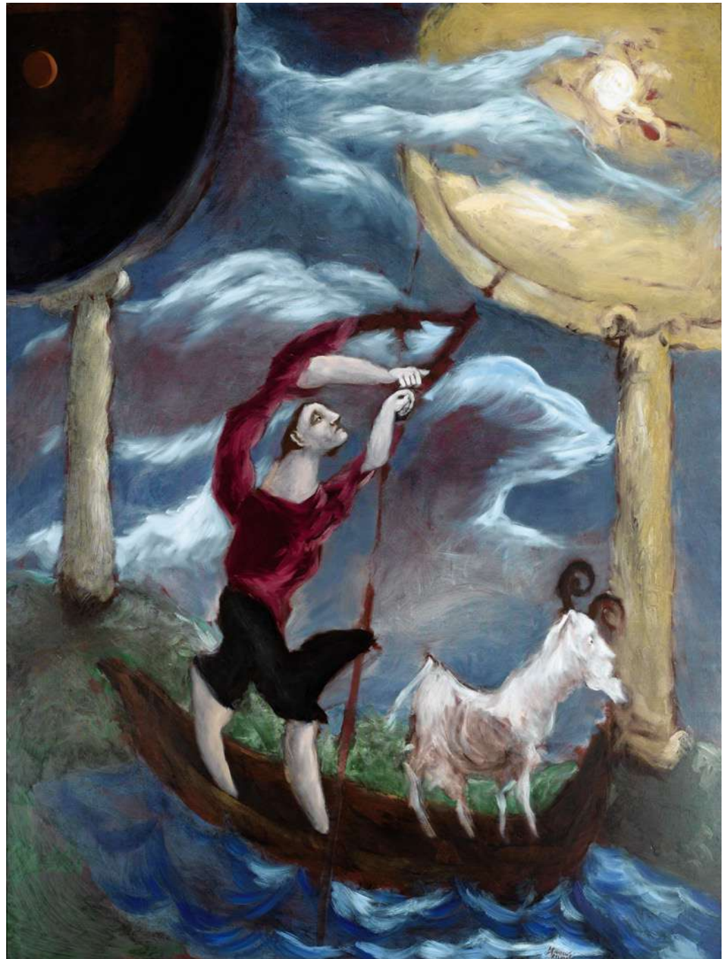
Le Pêcheur et la chèvre (de la série Don Quichotte), 1998 Huile sur toile 260 x 200 cm — 102 3/8 x 78 3/4 in.