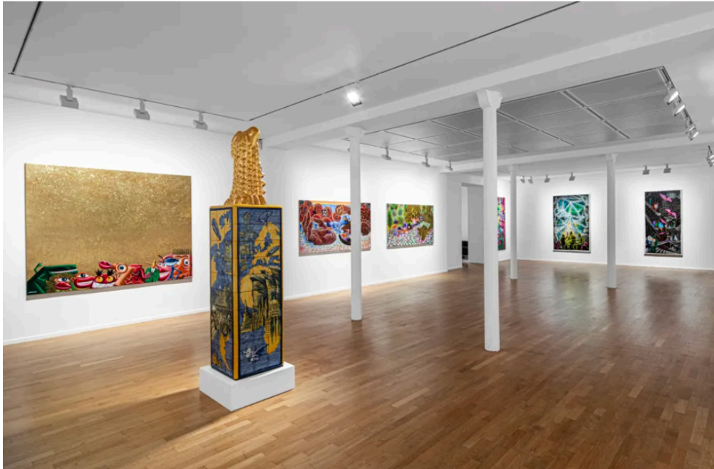
In situ